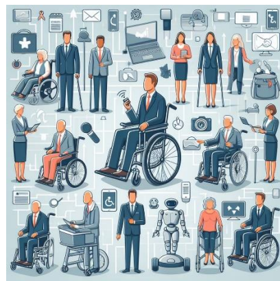
Bild erstellt mit KI durch Microsoft Bing – Image Creator vom Designer, 19.12.2023

Dienstag, 30. Januar 2024, 17:00 - 18:30 Uhr (mit anschliessendem Apéro) im SAZ Burgdorf